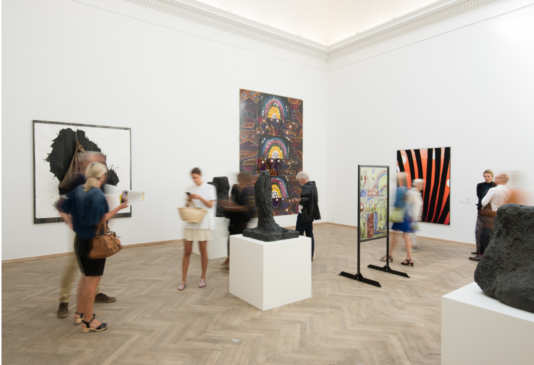
Galleri Bo Bjerggaard og Galleri Nicolai Wallner på CHART ART FAIR 2018

CHART PRÆSENTERER 32 NORDISKE GALLERIER PÅ CHART ART FAIR OG UDVIDER MED 12 UDSILLERE PÅ EN NY SEKTION, CHART DESIGN, I DEN FRIE UDSILLINGSBYGNING